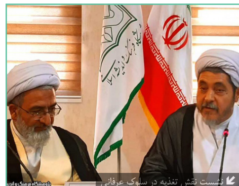
نشست نقش تغذیه در سلوک عرفانی

دومین نشست علمی همایش عرفان اهل بیتی با عنوان «نقش تغذیه در سلوک عرفانی» روز دوشنبه مورخ ۲۴ تیرماه جاری توسط گروه عرفان پژوهشکده حکمت و دین‌پژوهی پژوهشگاه فرهنگ و اندیشه اسلامی و با حضور صاحب‌نظران این حوزه در سالن فرهنگ پژوهشگاه دفتر قم برگزار شد.