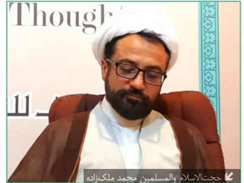
حجت‌الاسلام والمسلمین محمد ملک‌زاده

همان گونه که انتظار می‌رفت نشست کمیسیون مشترک برجام در وین در آخرین روزهای ضرب الاجل ایران به اروپا بدون حصول هیچ پیشرفت قابل قبولی برای ایران پایان یافت. در بررسی نتایج این نشست و مواضع طرف‌های شرکت کننده در آن نکاتی قابل توجه می‌باشد.