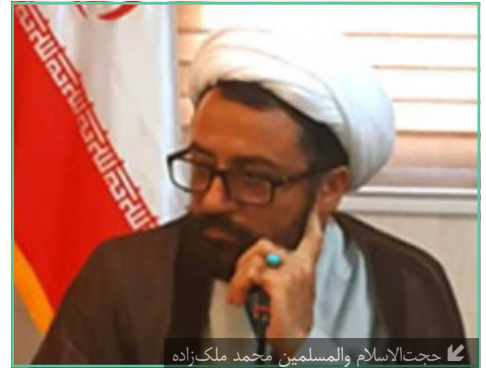
حجت‌الاسلام والمسلمین محمد ملک‌زاده

بدون هیچ‌گونه مسامحه و خویشتنداری بی‌مورد است. این چیزی است که به گفته گاردین حتی باید مورد انتظار دولتمردان انگلیسی هم باشد. (متن کامل در پیوند)